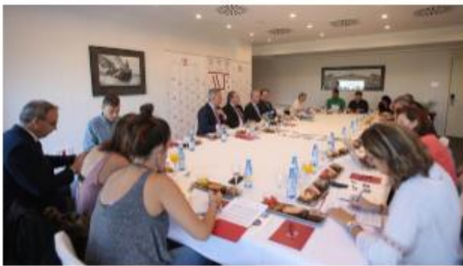
Imagen de la presentación del congreso de la Empresa Familiar - ABC