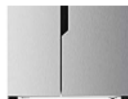
HISENSE RS670N4HC2 ... €635,75